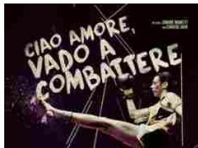
I Wonder Pictures e Biografilm Festival presentano l'anteprima di "Ciao amore, vado a combattere"