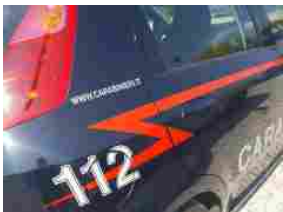
Arresti e denunce dei carabinieri di Bologna