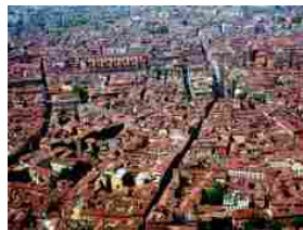
Piano Urbano della Mobilità Sostenibile metropolitano: approvato l'accordo per avviare le procedure di gara