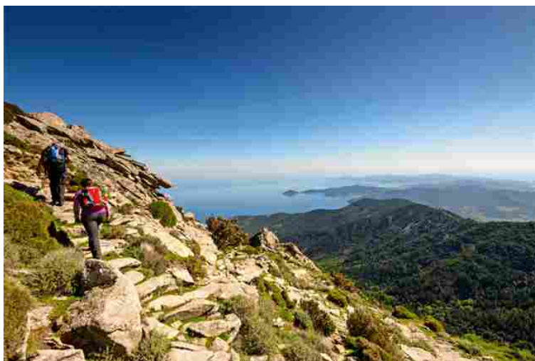
Un'immagine dell'Isola d'Elba (foto Natalino Russo).