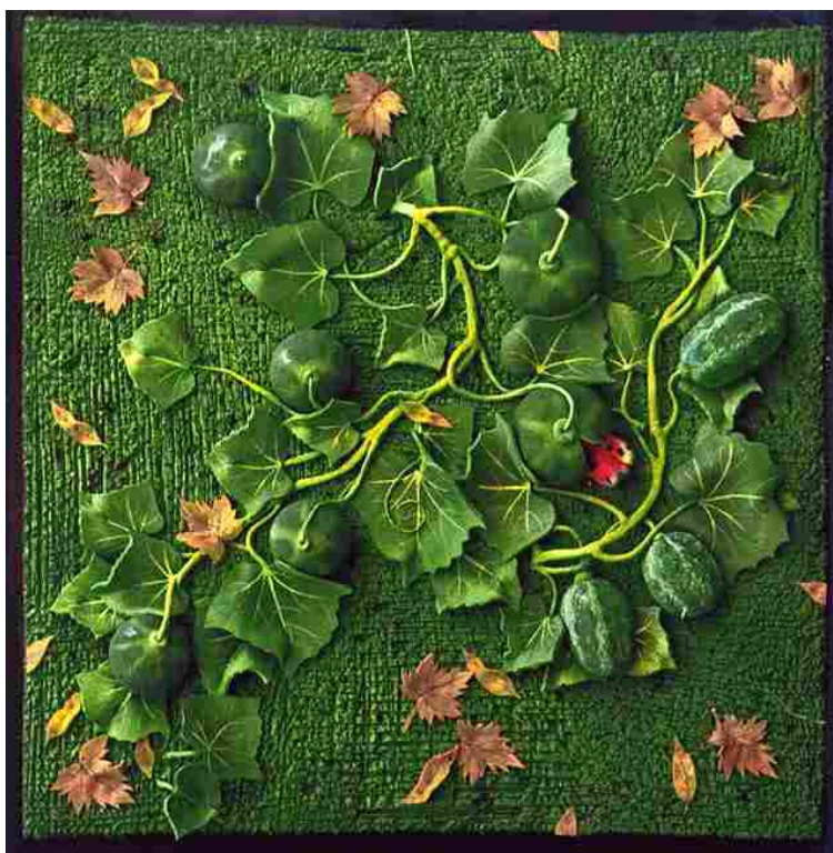
Piero Gilardi, "Angurie, 1967".