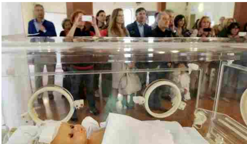
Bologna, ecco il Festival della scienza medica