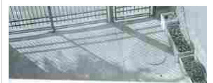
Appartamenti Limbiate Via Gorizia 22