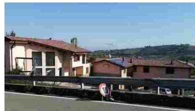
Appartamenti Via Marano snc - 96188